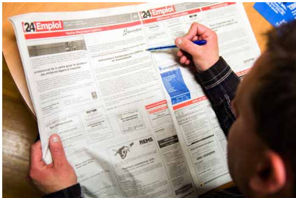
Mit zunehmender Dauer der Arbeitslosigkeit steigt das Risiko einer länger anhaltenden oder dauerhaften Abhängigkeit von Sozialleistungen erheblich an.

Beziehen erstmals oder erneut arbeitslos gewordene Personen länger und öfter Sozialleistungen? Um welche Sozialleistungen handelt es sich und wie lange dauern die Bezugsperioden? Anhand eines neuen Datensatzes mit Angaben aus der Arbeitslosenversicherung, der Invalidenversicherung und der Sozialhilfe sind erstmals die Leistungsbezüge von neuen Beziehenden von Arbeitslosenentschädigung während einer Periode von sechs Jahren untersucht und anhand von Risikoprofilen charakterisiert worden.